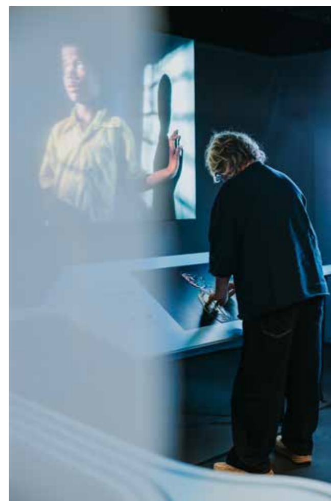
Dunne gordijnen en een handrail dragen bij aan een gelijkwaardige bezoekerservaring.

Verschillende fotografen laten zien hoe blind- en slechtziendheid hun blik, werkwijze of onderwerp raakt. De foto’s komen tot leven in beeld, reliëfprint en audio. Of je nu kunt zien, blind of slechtziend bent: door te voelen, te luisteren en te kijken beleef je fotografie op een nieuwe, verrassende manier.’