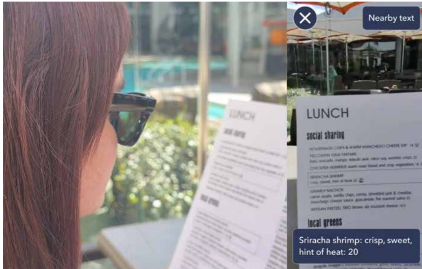
De bril leest het menu voor.

Veel dagelijkse dingen kosten moeite en energie als je slechtziend bent. Hoe kies je bijvoorbeeld de juiste kleur sokken, hoe vind je het pak melk in de supermarkt of de ingang van het gemeentehuis? De slimme OOrion-app assisteert mensen hierbij. Sinds kort is deze app beschikbaar op alle AI glasses (slimme bril) van Meta. Een doorbraak, mede mogelijk gemaakt door het Bartiméus Fonds.